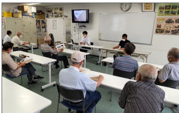
講習会当日は会員12名の方が参加されました

8月24日(水)に「暮らしの危険対策セミナー」を開催しました。あいおいニッセイ同和損害保険株式会社の講師様より、高齢者の家庭内における死亡事故件数は交通事故よりも多く、最も慣れていて安全と思われる自宅内の居室や階段での転倒や転落事故が発生しているため、つまずきやすい荷物が置かれていないか、階段の手すりが適切に設置されているかなどの確認と安全対策が大切であると受講しました。会員みなさまにおかれましても、家庭内各所の状況について今一度確認をしていただき事故防止に努めてください。