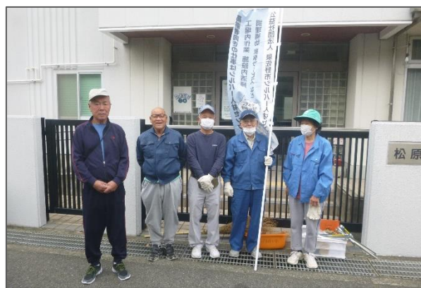
10月6日(木)松原班5名参加 早朝よりごくろうさまでした