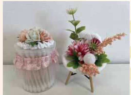
◆フラワーアレンジメント◆ 後藤 美佐子 西部1班