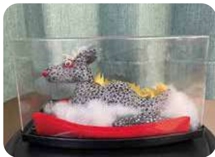
◆手芸「干支」◆ 宮本 幸江 幸町班