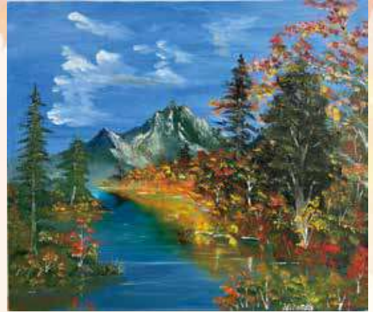
◆油絵◆ 平床 正隆 市場中町班