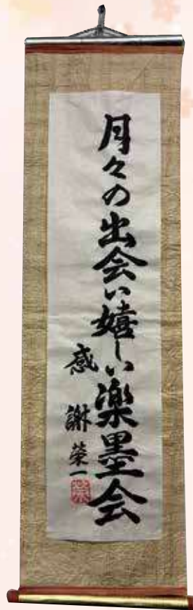
◆書◆ 西内 栄一 湊班