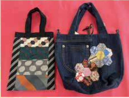
◆ネクタイ・ジーンズをリメイク◆